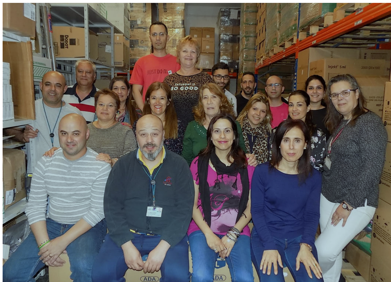
Equipa do Serviço de Aprovisionamento do Centro Hospital Barreiro Montijo

“ Continuaremos a manter esta nossa visão, com particular enfoque no cliente, numa perspetiva de manter os resultados de satisfação obtidos nos últimos anos, mantendo uma atitude de responsabilização e envolvimento. ”