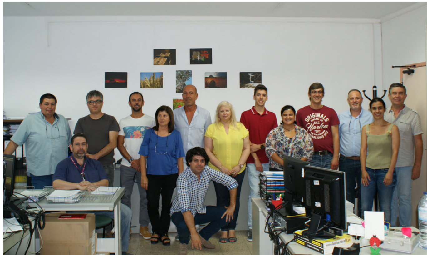
Equipa do Serviço de Compras da Unidade de Saúde Local do Baixo Alentejo

gram o Departamento de Agrupamento de Centros de Saúde, estando estes serviços centralizados na sede, em Beja, mas existindo armazéns avançados nos treze Centros de Saúde. Esta área, em concreto, integra o Serviço de Aprovisionamento Logística e o Serviço de Transportes. O serviço de Aprovisionamento Logística é composto por cinco unidades: o Gabinete Técnico, a Unidade Compras, a Unidade de Logística, a Unidade de Património e Imobilizado e, por último, a Reprografia.