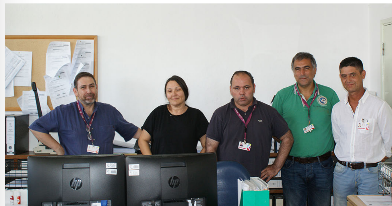
Equipa do Serviço de Transportes da Unidade de Saúde Local do Baixo Alentejo

Todos estes processos deverão ter modelos inovadores, de modo a permitir a concorrência e o acesso das pequenas e médias empresas, mesmo de carácter