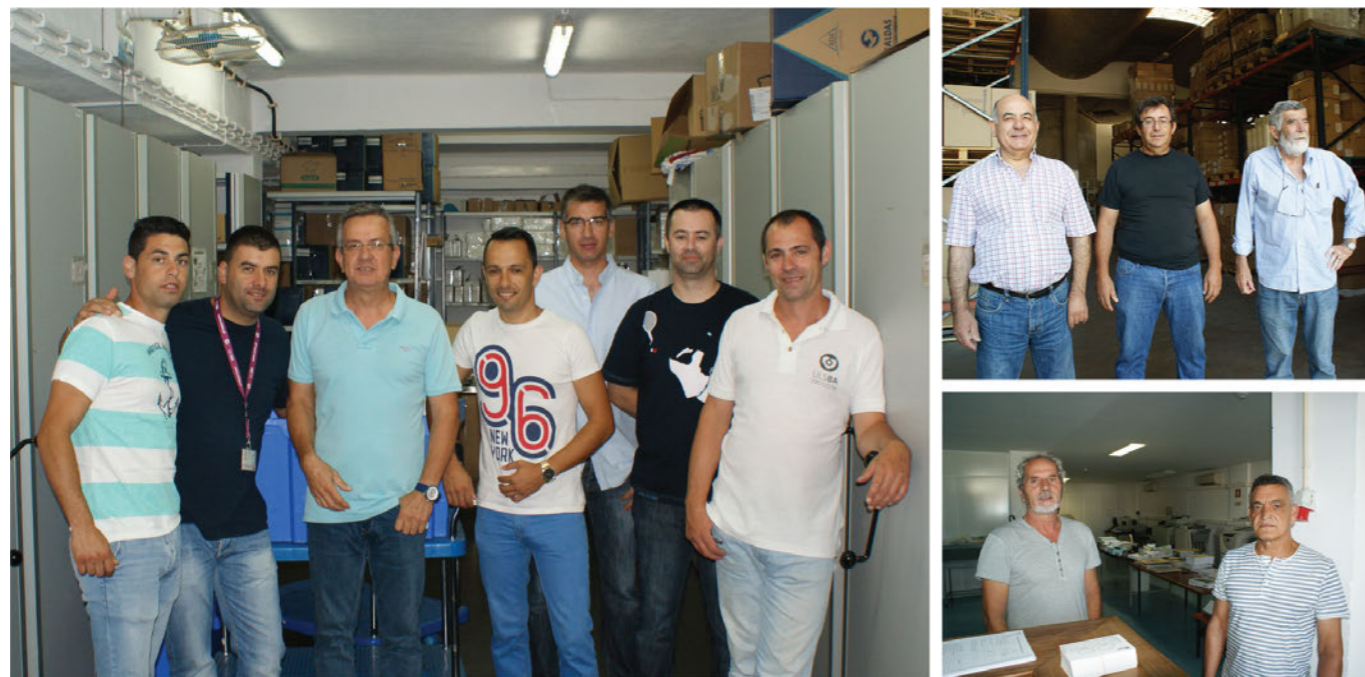
Equipas da Unidade de Saúde Local do Baixo Alentejo (Armazém Central e Reprografia)

Somos um país onde os juízos de valor são muito facilmente emitidos, pelo que a criação de grupos trabalho e mesmo a implementação de visitas, para partilha de experiências, poderá ser uma forma de melhorar a relação e a qualidade dos processos de compra, de parte a parte.